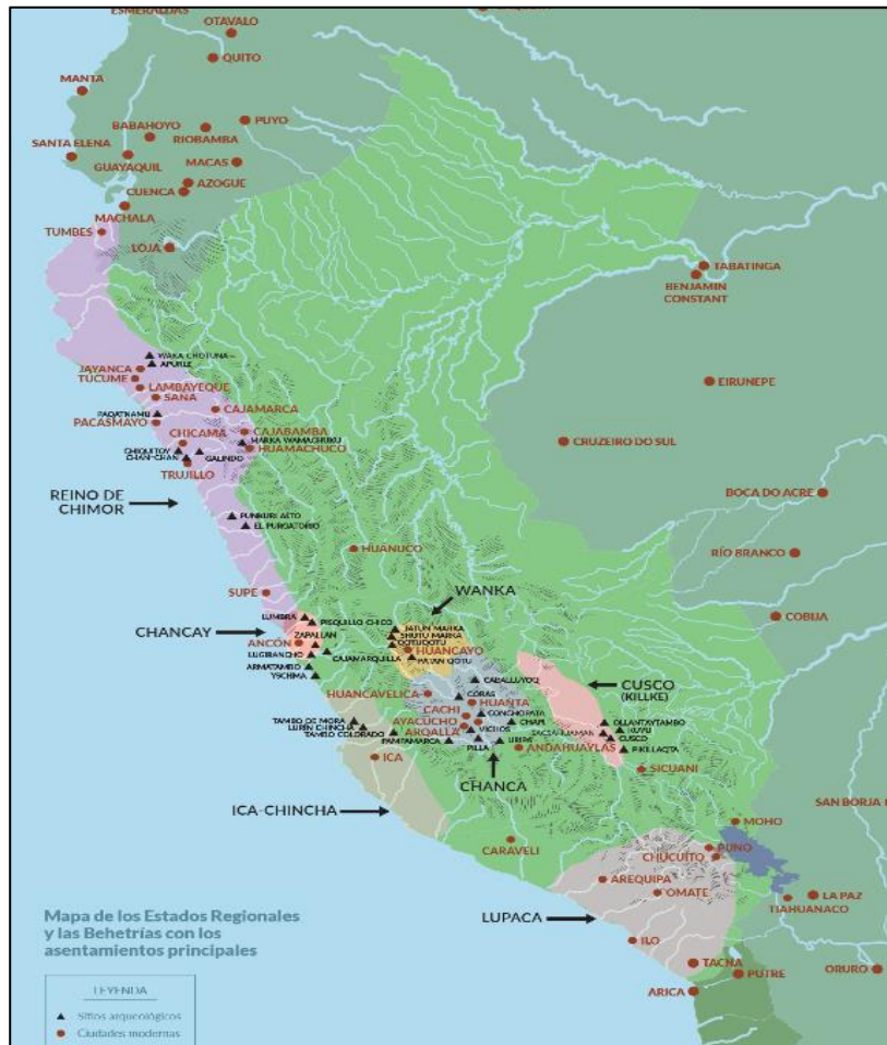
Mapa de expansión territorial de Chimú