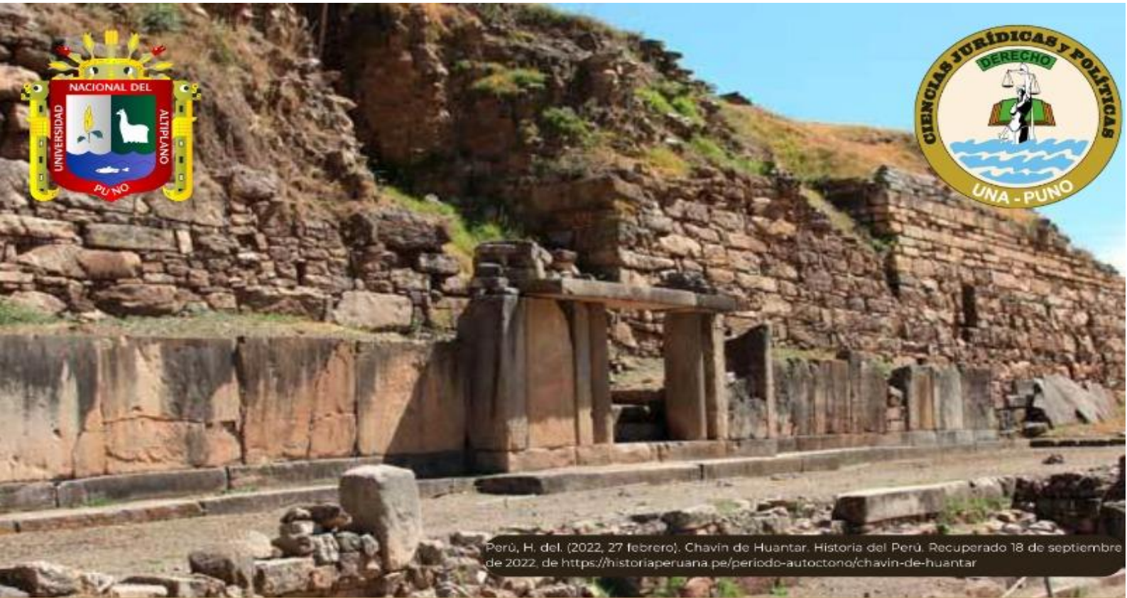
Perú, H. del. (2022, 27 febrero). Chavín de Huántar. Historia del Perú. Recuperado 18 de septiembre de 2022, de https://historiaperuana.pe/periodo-autoctono/chavin-de-huantar