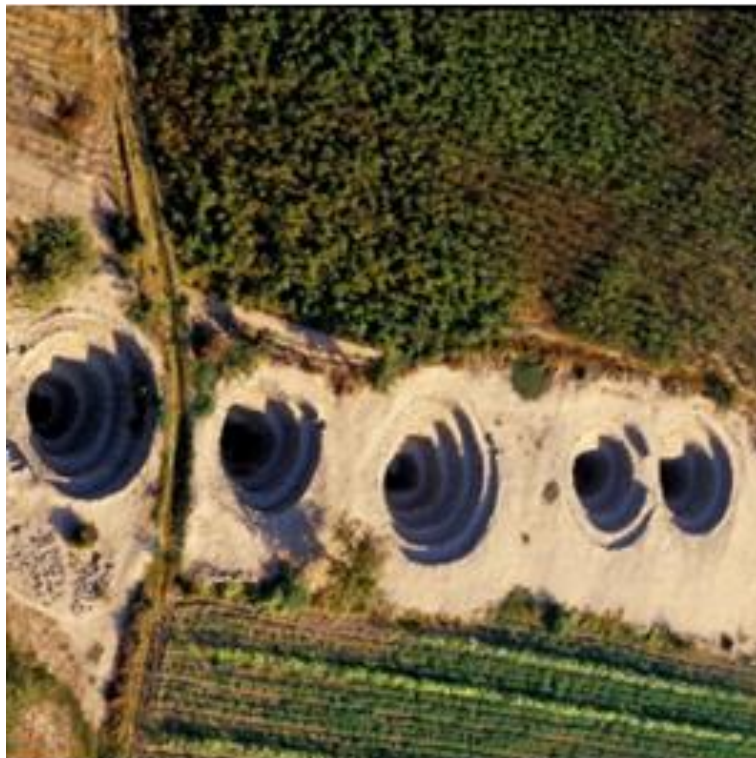
Acueductos de Cantalloc

Nota: La figura representa que la tecnología Nazca aún se emplea y demuestra que este Estado contaba con un importante avance científico. Adaptado de Hidráulica Inca., 2017.